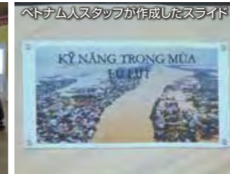
ベトナム人スタッフが作成したスライド