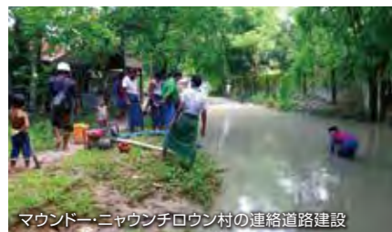
マウンドー・ニャウンチロウン村の連絡道路建設

「支援ニーズ即応事業」は道路建設などを通して、現地で支援を行う他団体の活動をも支えています。コロナ禍でいつまた活動が中断されてしまうか先が読めませんが、まずはスタッフの安全を守り、万全の対策をとりながら事業を進めていききたいと思います。