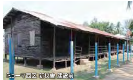
ミョーマ西区 新校舎 建設前

一方、PTA強化研修や防災研修などのいわゆる密な状況を生むような活動については、未だ活動許可が下りておらず、3月以降実施できていません。こういったソフト面での活動もこの事業における大きな柱の一つになっており、一日も早くこちらの事業も再開できることを願いつつ引き続き状況を見守っていききたいと思います。