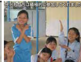
子どもたちは積極的に参加してくれました