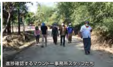
進捗確認するマウンドー事務所スタッフたち