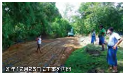
昨年12月25日に工事を再開