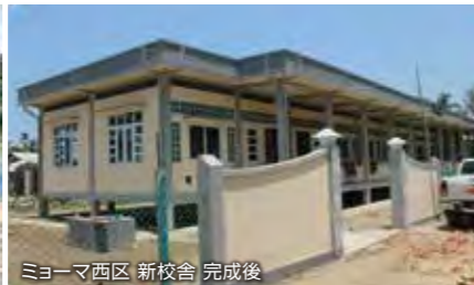
ミョーマ西区 新校舎 完成後