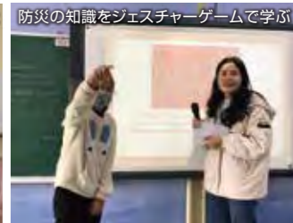
防災の知識をジェスチャーゲームで学ぶ