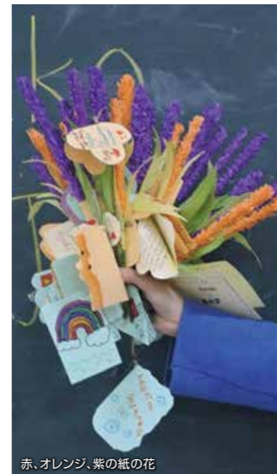
赤、オレンジ、紫の紙の花

アジ子サポーターの皆さまには成長記録(1年間の活動記録)を一緒にお送りしています。子どもたちのインタビューも掲載しています。アジ子サポーターにご興味のある方は是非BAJのホームページまでお問い合わせください。