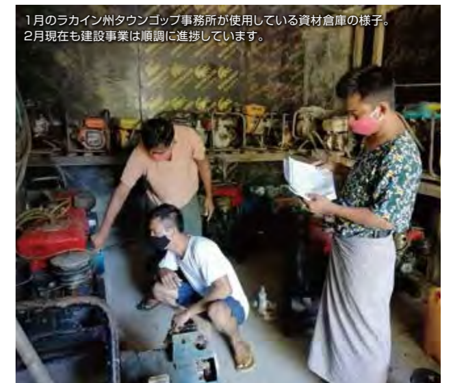
1月のラカイン州タウンゴップ事務所が使用している資材倉庫の様子。 2月現在も建設事業は順調に進捗しています。