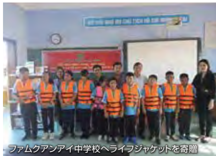
ファムクアンアイ中学校へライフジャケットを寄贈