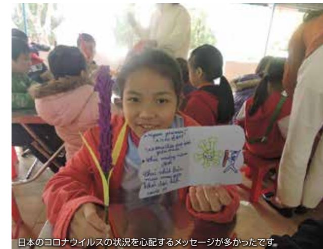
日本のコロナウイルスの状況を心配するメッセージが多かったです