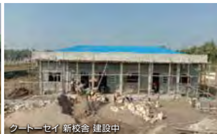
クートーセイ 新校舎 建設中