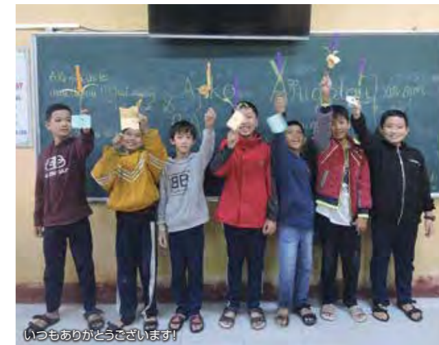
いつもありがとうございます!