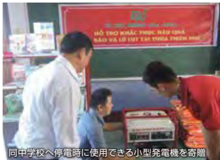
同中学校へ停電時に使用できる小型発電機を寄贈