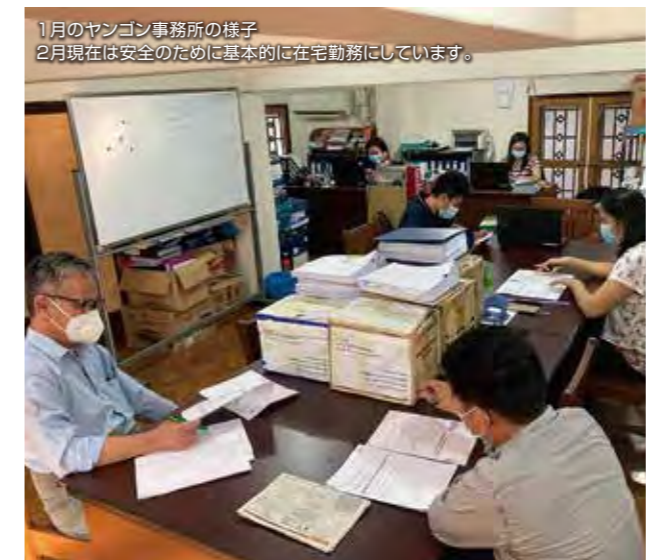
1月のヤンゴン事務所の様子 2月現在は安全のために基本的に在宅勤務にしています。

BAJがラカインで活動を開始した1995年前後は軍事政権でした。初めての海外での活動で戸惑うことも多かったのですが、BAJの使命は、現地で困っている人たちに寄り添い、一緒に汗を流しながら、できることから少しでも改善していこう、というものです。この方針は現在も変わりません。これからも可能なかぎり現地での活動を粛々と進めていきます。