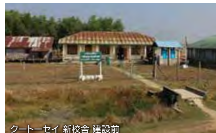
クートーセイ 新校舎 建設前