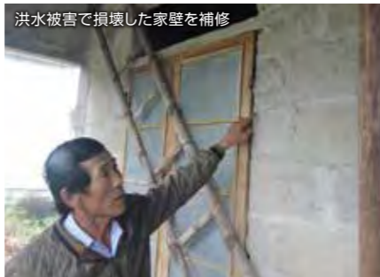
洪水被害で損壊した家壁を補修