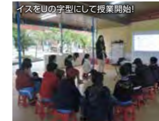
イスをUの字型にして授業開始!