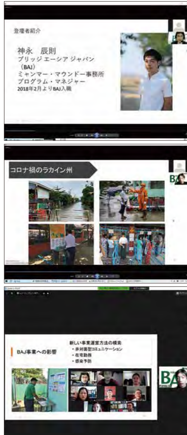
BAJにとって初めてのオンライン活動報告会でした。ZoomというWeb会議ツールを使いました。