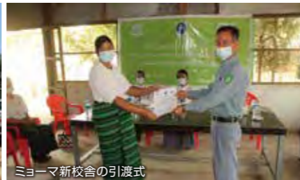
ミョーマ新校舎の引渡式