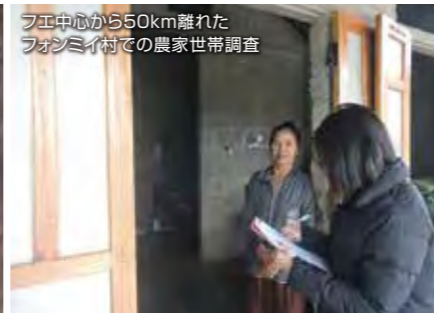
フエ中心から50km離れたフォンミイ村での農家世帯調査