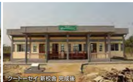
クートーセイ 新校舎 完成後