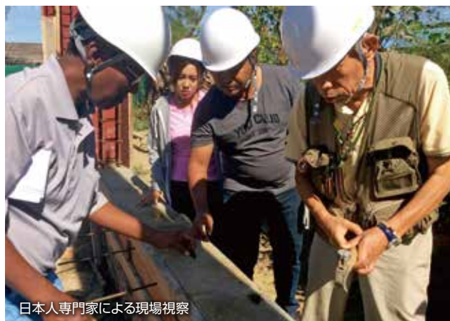
日本人専門家による現場視察