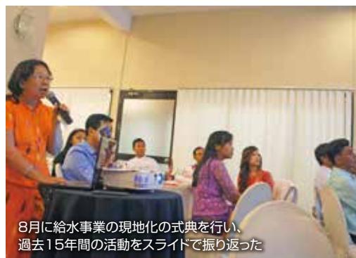
8月に給水事業の現地化の式典を行い、過去15年間の活動をスライドで振り返った