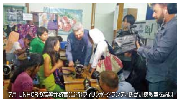
7月 UNHCRの高等弁務官(当時)フィリッポ・グランディ氏が訓練教室を訪問