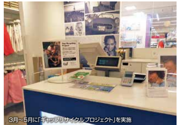
3月～5月に「ギャップリサイクルプロジェクト」を実施