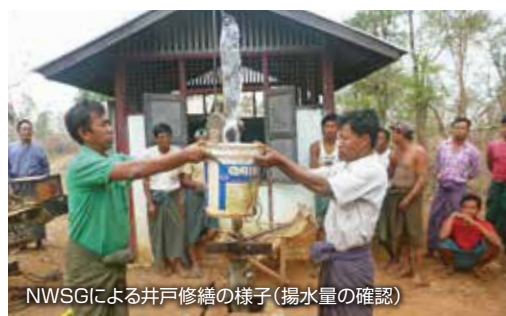
NWSGによる井戸修繕の様子(揚水量の確認)