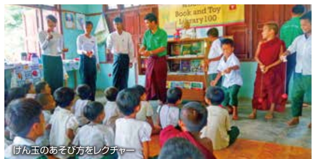
けん玉のあそび方をレクチャー