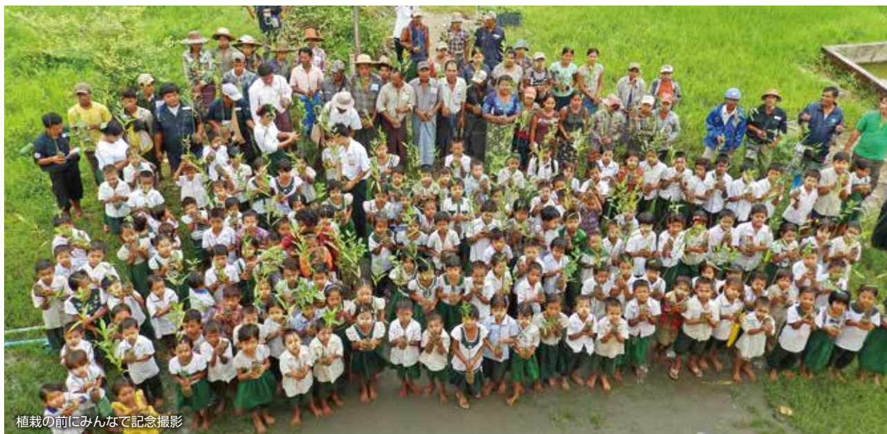
植栽の前にみんなで記念撮影

「FREDA」や村人たちと協働して防風林の植栽を実施しました。約1万本のマングローブを中心とした樹木の1年生苗木を、校舎を囲む形で植栽しました。