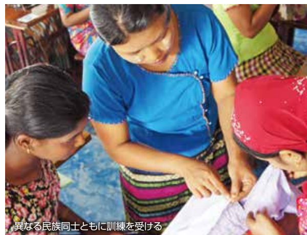
異なる民族同士ともに訓練を受ける