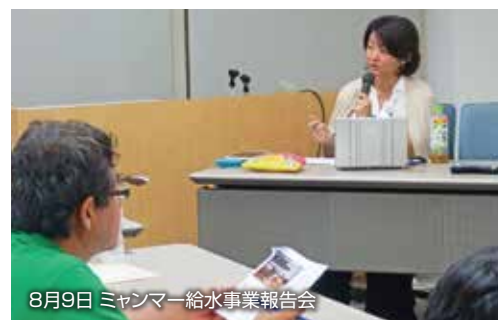
8月9日 ミャンマー給水事業報告会