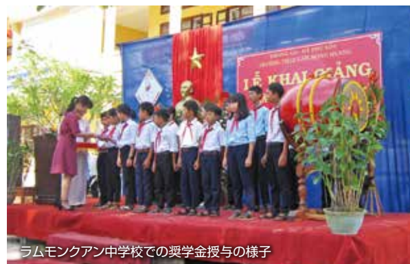
ラムモンクアン中学校での奨学金授与の様子

またトゥイスワン小学校と環境グループについても2018年に授与することになりました。