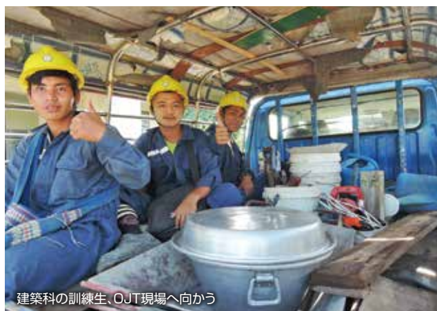
建築科の訓練生、OJT現場へ向かう