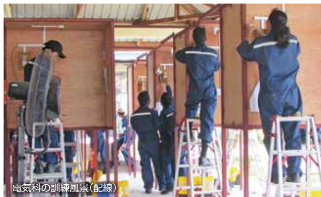
電気科の訓練風景(配線)