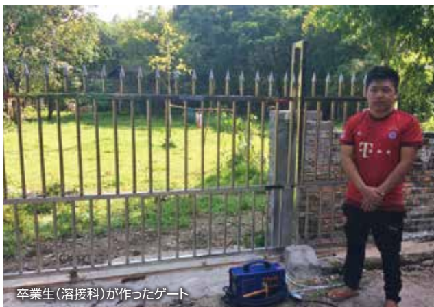
卒業生(溶接科)が作ったゲート