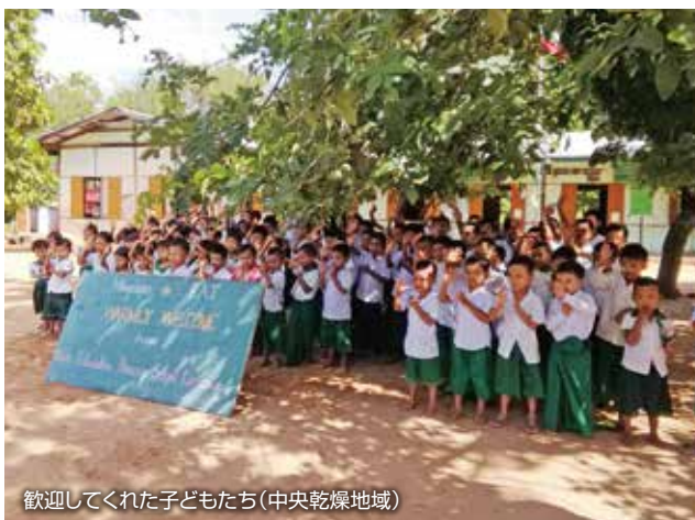
歓迎してくれた子どもたち(中央乾燥地域)

大切に使用してもらえるよう子どもたちや先生、親を対象に利用研修を実施しています。