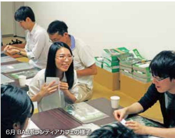
6月 BAJボランティアカフェの様子

インターンについては、目標設定や評価、報告などかなり時間を割く必要があるため、BAJの受入れ態勢の問題で受入れを絞り、社会人2名、学生5名でしたが今後は拡大させていく計画です。