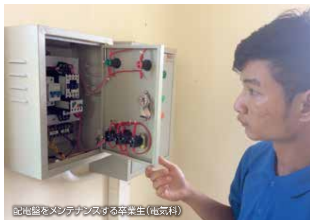
配電盤をメンテナンスする卒業生(電気科)