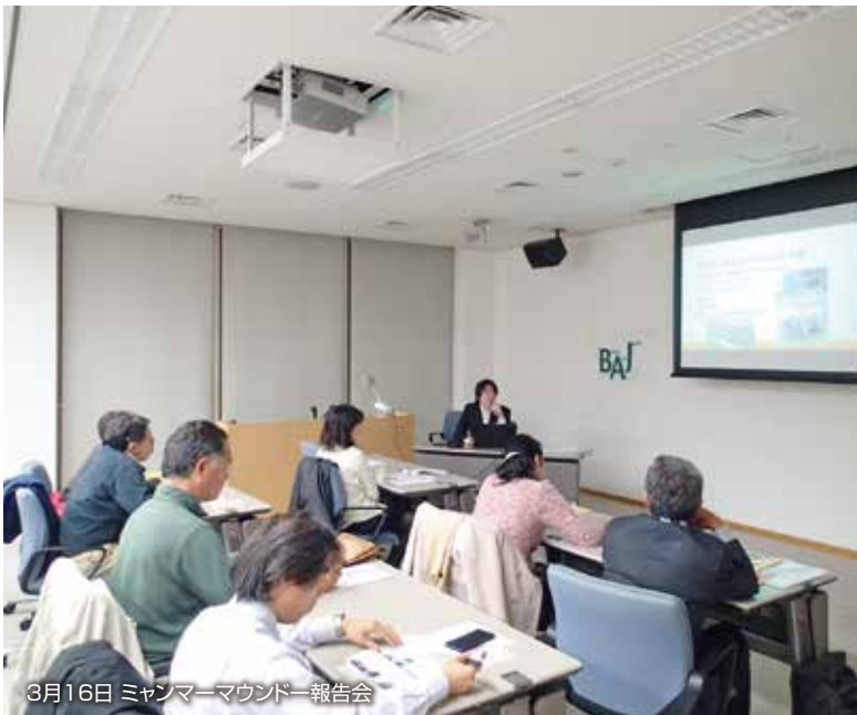
3月16日 ミャンマーマウンドー報告会

支援者を広げる手段として、一時帰国の職員による現場からの報告会5回、現場に派遣した専門家の報告4回、インターン報告会2回、他組織主催報告会登壇5回、出張講演・講義4回など、機会があれば積極的に参加して活動を紹介しました。