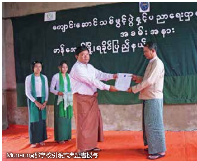
Munaung郡学校引渡式典証書授与

た約10名の青年を雇用し、座学と実地のオンザジョブトレーニング(OJT)で学校建設を進めています。技術習得を認められ、引き続き現場で働く意志がある若者については、次の現場で雇用して活躍してもらいます。