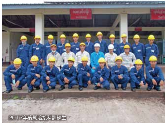
2017年後期溶接科訓練生

2017年は懸案であった、建設科作業棟、電気科作業棟、式典ホールを新たに建設し、実習の充実を図りました。