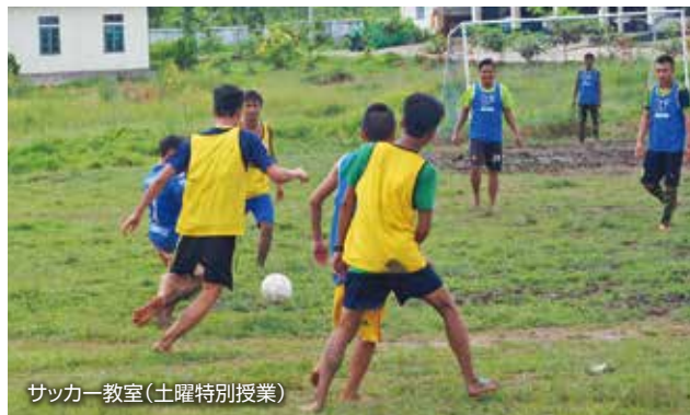
サッカー教室(土曜特別授業)