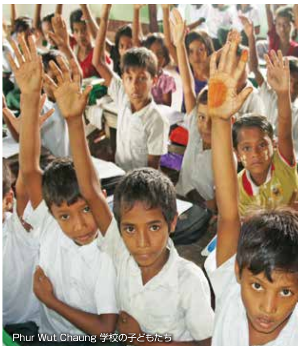
Phur Wut Chaung 学校の子どもたち

5月30日に襲来したサイクロンモラにより損壊を受けた校舎7校を対象に、日本財団と自己資金により修繕・再建を行いました。