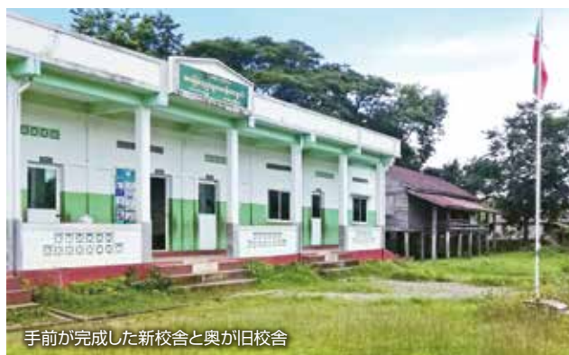
手前が完成した新校舎と奥が旧校舎