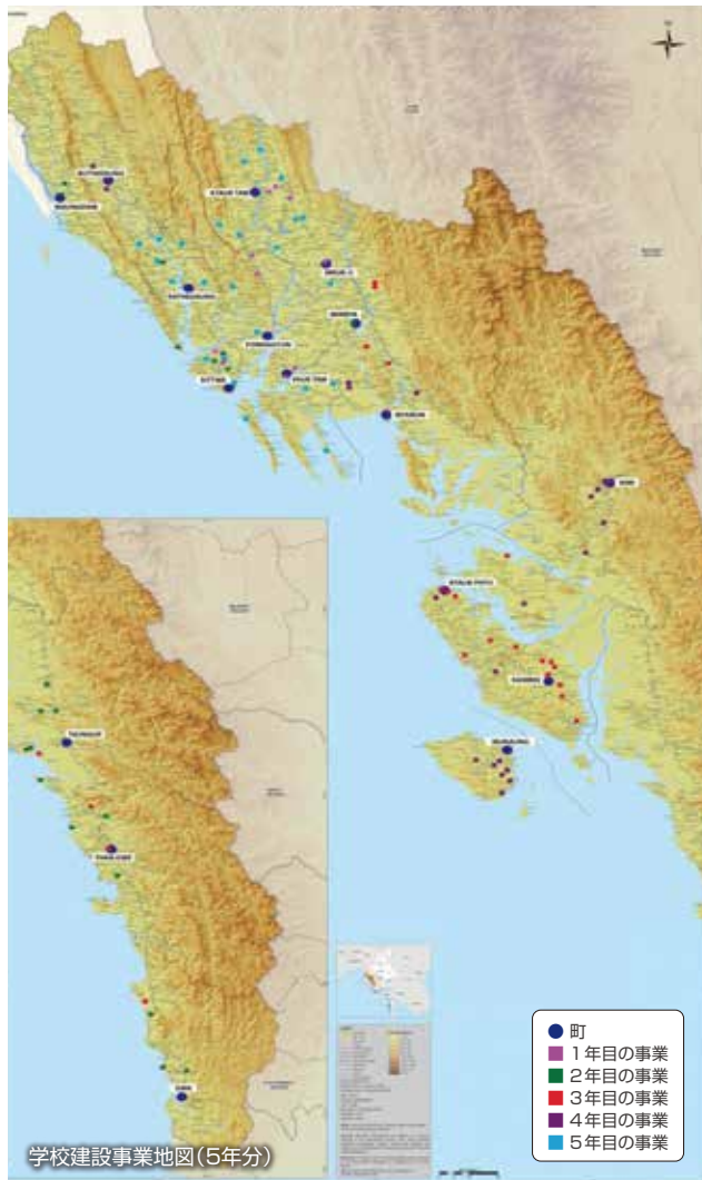
学校建設事業地図(5年分)