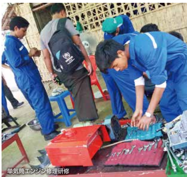
単気筒エンジン修理研修