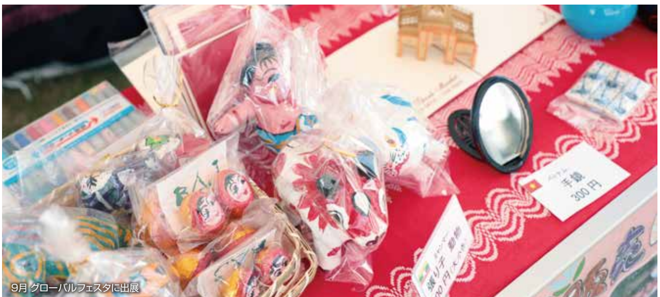
9月 グローバルフェスタに出展