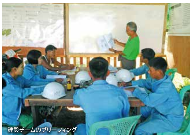
建設チームのブリーフィング