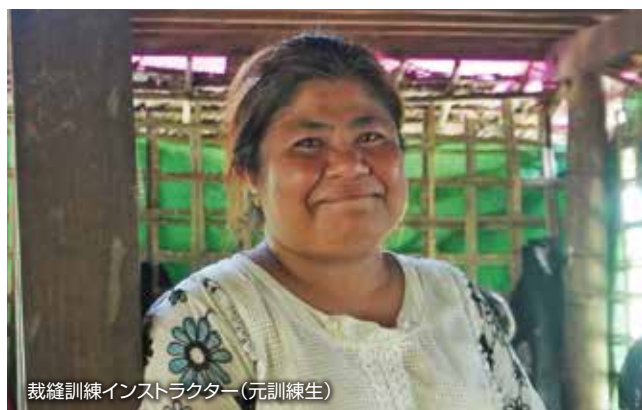
裁縫訓練インストラクター(元訓練生)

ラカイン、ムスリム、その他民族と一緒に学ぶことで民族融和を図ることを目的に、2016年に引き続き、裁縫訓練、コンピュータ、機械の研修を実施しました。ただし2016年10月に国境警備警察襲撃事件が起き、一時活動を停止してから再開したため、2017年2月ようやく2016年のコースを完了しました。引続き3月からは2017年の事業を開始しましたが、8月25日に再び国境警備警察署など政府施設への大規模な襲撃事件が起き、マウンドーでのすべての活動を一時停止、あるいは中止することになりました。