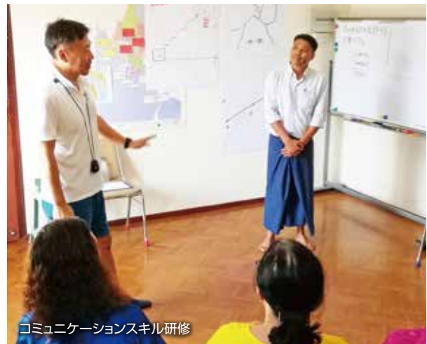
コミュニケーションスキル研修