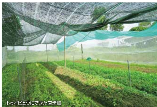
トゥイビエウにできた直営畑

2016年に実施したラムドン省ダラット、クアンナム省ホイアンの有機野菜販売企業の視察研修をきっかけに、「有機栽培技術研修・組織力強化事業」を進めました。2017年はフエ市トゥイビエウ地区に畑を借り上げ、農家グループ有志と現地スタッフにより7月から野菜栽培を開始、8月には直売所への野菜出荷を始めています。今後この畑を活用して「農家体験ツアー」などを検討しています。