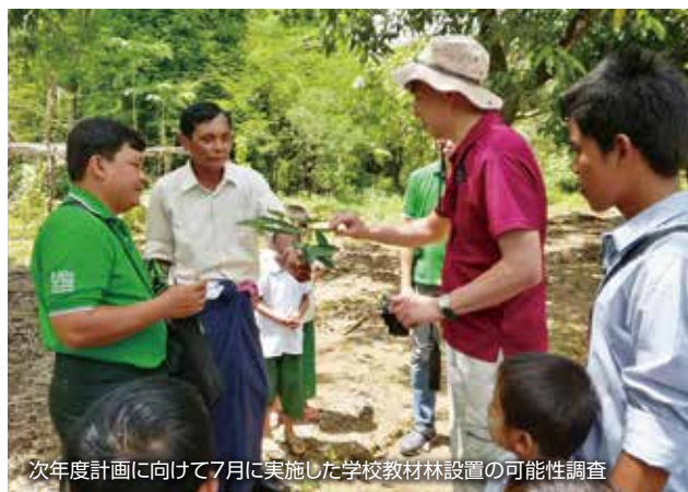
次年度計画に向けて7月に実施した学校教材林設置の可能性調査