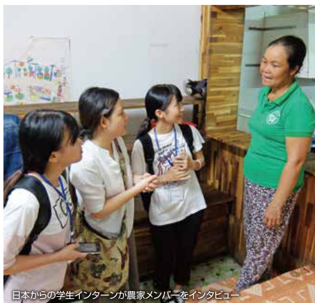
日本からの学生インターンが農家メンバーをインタビュー