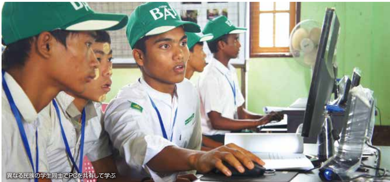
異なる民族の学生同士でPCを共有して学ぶ