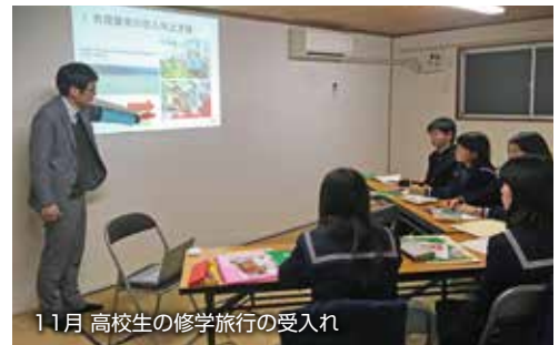
11月 高校生の修学旅行の受入れ