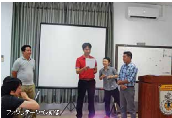
ファンリテーション研修