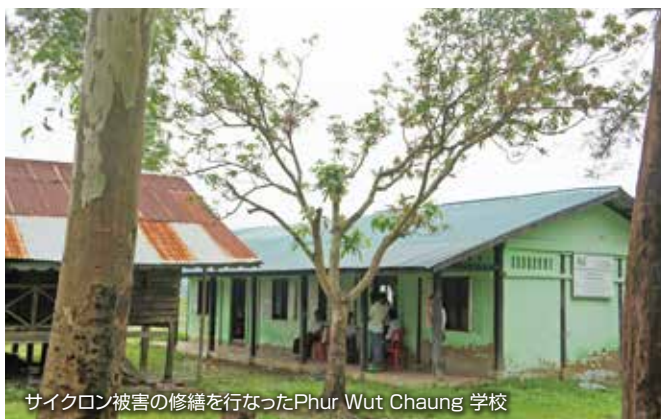
サイクロン被害の修繕を行なったPhur Wut Chaung 学校