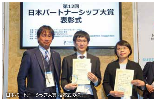
日本パートナーシップ大賞 授賞式の様子

本取り組みは3月に「第12回日本パートナーシップ大賞」でグローバルスマイル賞を受賞しました。