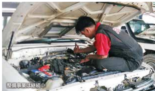
整備事業は継続中

マウンドー事務所内のワークショップでは、国連機関、国際NGO、ミャンマー政府機関の車両、発電機、船外機などの修理を通して500件余りの各団体支援と、燃料ろ過サービスを行いました。8月25日の襲撃事件以降、ラカイン人スタッフのみで運営しました。