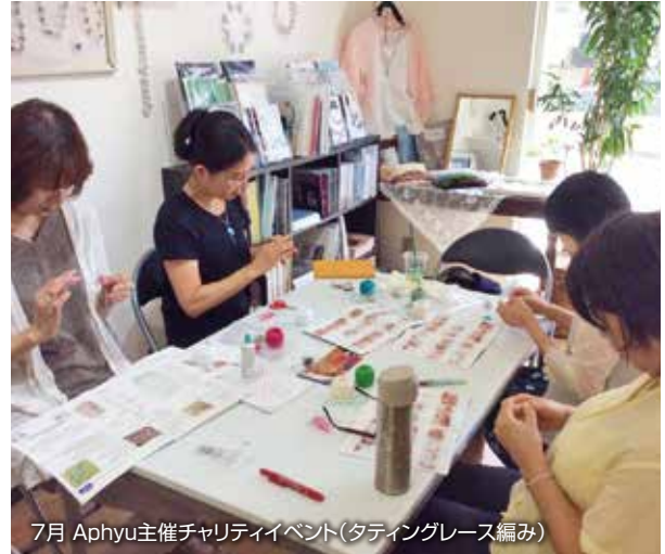
7月 Aphyu主催チャリティイベント(タティングレース編み)

2016年～2018年にかけて実施した募金キャンペーンは右記の通りです。夏と冬の2回実施し、とくに冬募金は多くの方にご支援いただきました。