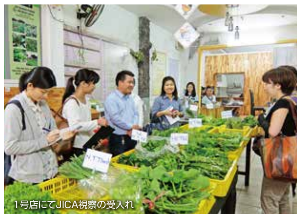
1号店にてJICA視察の受入れ

2014年に開店したフエ市ハイバーチユンの直売所は、出荷農家10世帯を中心に運営を進め、店舗の契約更改に伴い内装などを手当てしました。需要の拡大に伴い、2016年10月には直売所2号店となる店舗をフンフンに開店し、両店舗ともに売り上げを伸ばしています。