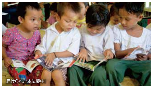
届けられた本に夢中!