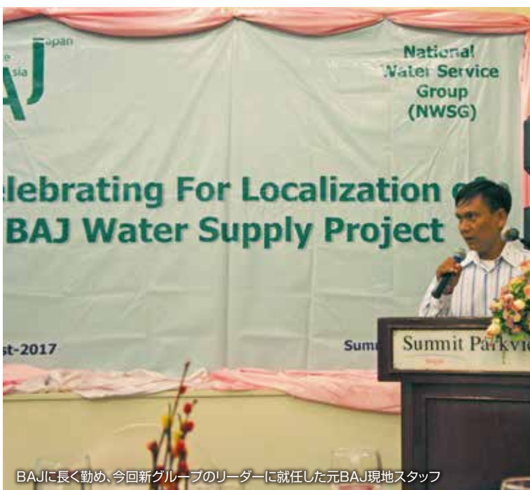
BAJに長く勤め、今回新グループのリーダーに就任した元BAJ現地スタッフ

2017年度は4本の新規深井戸掘削、8本の井戸修繕を実施しました。井戸修繕をおこなった村では長期維持管理のための研修を実施しました。