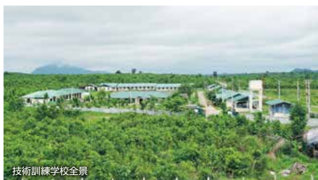
技術訓練学校全景