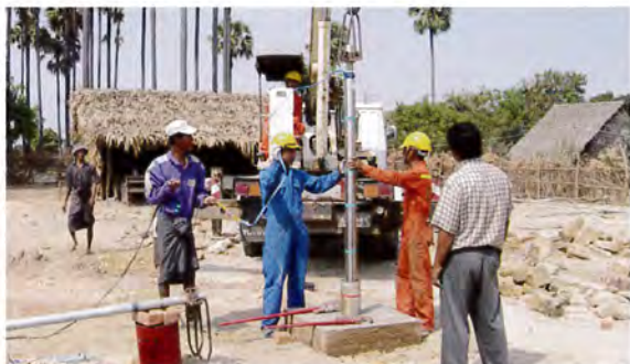
さまざまなデータを取りながら、慎重に作業を進めていく