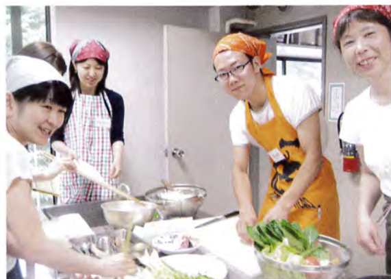
男性もエプロンを着けて参加、ベトナムおうちごはんDE国際協力

■外部からの依頼による、あるいは申請して実施した主な講演やイベントは以下の通りです。