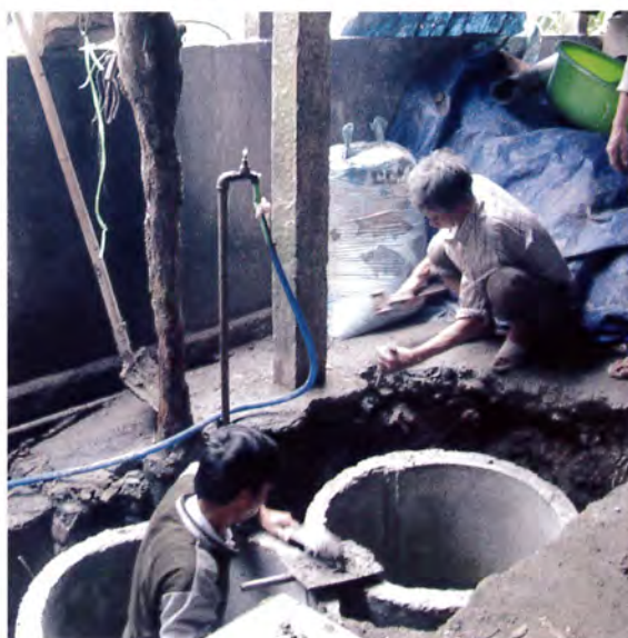
住民も参加してバイオガスダイジェスターの設置作業