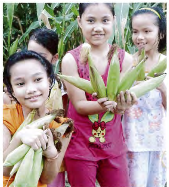
トウモロコシがこんなに収穫できた

トゥイスワン地区の家畜飼育農家を対象に、環境汚染対策と収入向上を目指して、バイオガスダイジェスターを設置し、副産物として採取したガスを燃料にしたり、液肥で有機栽培を行うなどリサイクル農業を実践しています。2011年8月から開始して2012年末に25世帯まで増え、農家グループとして畜産物を消費者に直接販売する提携を始めています。