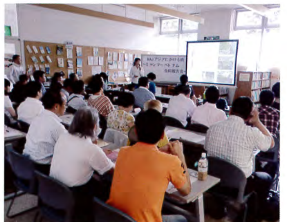
一時帰国したBAJスタッフの報告会では、現場の様子がよく分かる