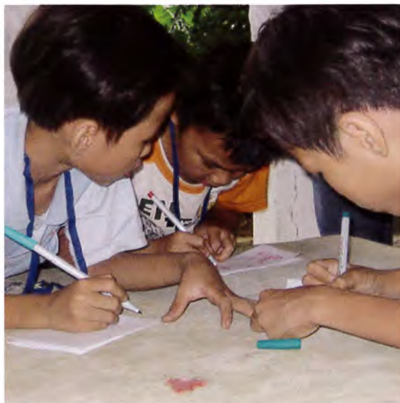
トゥイビエウ地区の子どもたちがレポートを書く…。 「なんて書いたの？」

日本予防医学協会では、国内で中古メガネの寄贈を受けており、ベトナムでの配布を希望されたため、BAJが配布のお手伝いをしました。2012年1月3日～6日までの4日間で、フエ市トゥイビエウ地区、フーヴァアン郡ヴィンハー地区・ヴィンタイ地区、フォンチャー郡フオンスワン地区、フーロック郡ヴィンジャン地区の6箇所、眼鏡の配布を実施しました。日本予防医学会から3名の専門家が参加して、検眼、眼鏡の選定・調整を行ったうえで、一人ひとりの状態にあわせた眼鏡を調整して、全体では256名に配布しました。