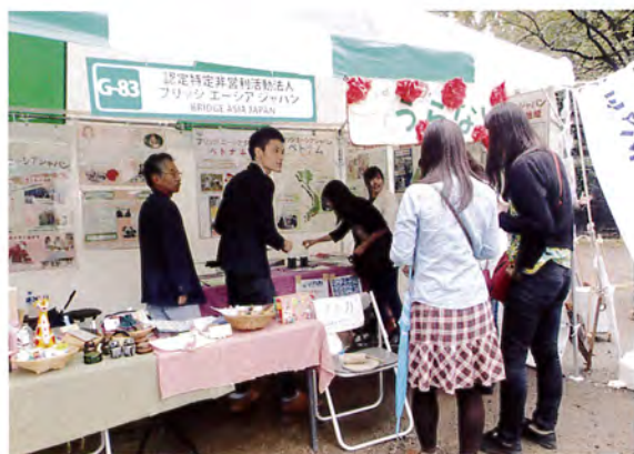
毎年恒例のグローバルフェスタではボランティアさんが中心です