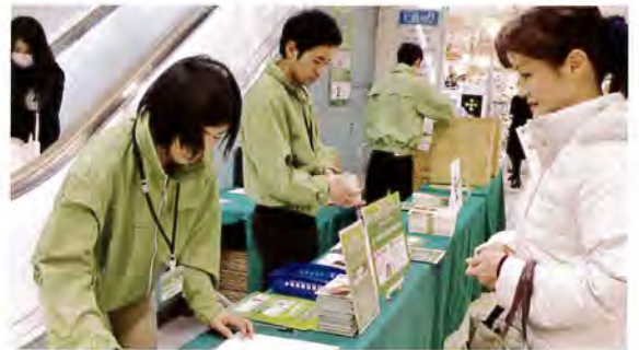
大型店舗で開催された古着回収イベントでたくさんの古着が集まりました

2012年度の1月～12月の倉庫受け取り分は、5,130箱で35,607.32キログラムでした。