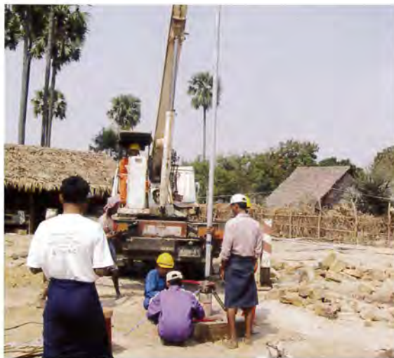
つりあげたパイプを堀削した孔におろしていく

三脚とは、修繕では井戸からロッドを引き上げるために三脚が必要で、彼らは自分たちでその三脚を制作したという経緯があります。