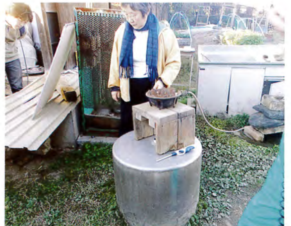
霜里農場でバイオガスコンロの実験