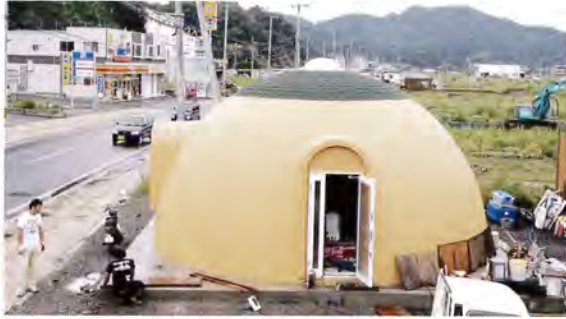
大槌町に建てられたドームはコミュニティセンターとして大活躍