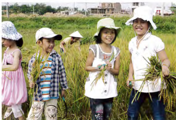
稲刈りも友だちみんなとやると楽しい

フービン地区、トゥビエウ地区、トゥイスワン地区の補習・絵画クラスの子どもたちに環境教育や地域を知ってもらう活動をしました。またトゥイスワン地区のグエンティミンカイ中学校の1年生を対象に9月から12月まで毎月2回、環境の授業を行いました。