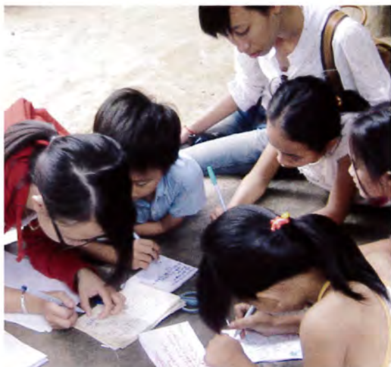
スタッフも子どもたちにアドバイスしながら見守ります

フエ市アンドン地区は製粉・製麺所が多い地域で、工場からの排水垂れ流しが問題となっていました。BAJでは2カ所の工場に簡易浄化槽を設置して、排水についての観察を続けて排水中にふくまれる成分や排水量を特定し、2012年3月に浄化槽の設置を完了しました。