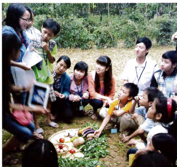
トゥイビエウ地区でBAJIKO教室の野菜の絵の紹介