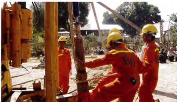
危険な作業もあるのでチームワークが大切