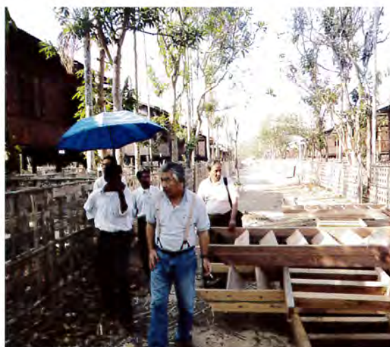
2ヶ月間で80棟のシェルターを建設

建設では、被災したモーヤワディ村の住民と、村外から集められた労働者（ラカイン人、ビルマ人、ムスリム）約160名が参加して、各機関と調整しながら、現場スタッフの尽力により、ほぼ工期通りの完成でした。完了直後には、UNHCR、ナタラほか政府関係機関の視察を受け、BAJの建設技術を高く評価していただきました。