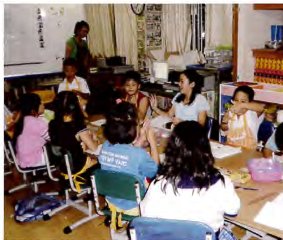
BAJIKOの子どもたちは工作が大好き