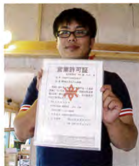
さんさんキッチンの 営業許可証がとれました

大船渡市「NPO法人 さんさんの会」は、震災後に立ちあがった地元のグループで、BAJはJPF(ジャパンプラットフォーム)の助成金を活用した第2フェーズとして、配食を中心としたコミュニティ活動事業を、2月11日～10月12日の期間で支援しました。また、9月22日に覚書を交わし、NPO法人として必要なスキルの研修を2回にわたって実施しました。