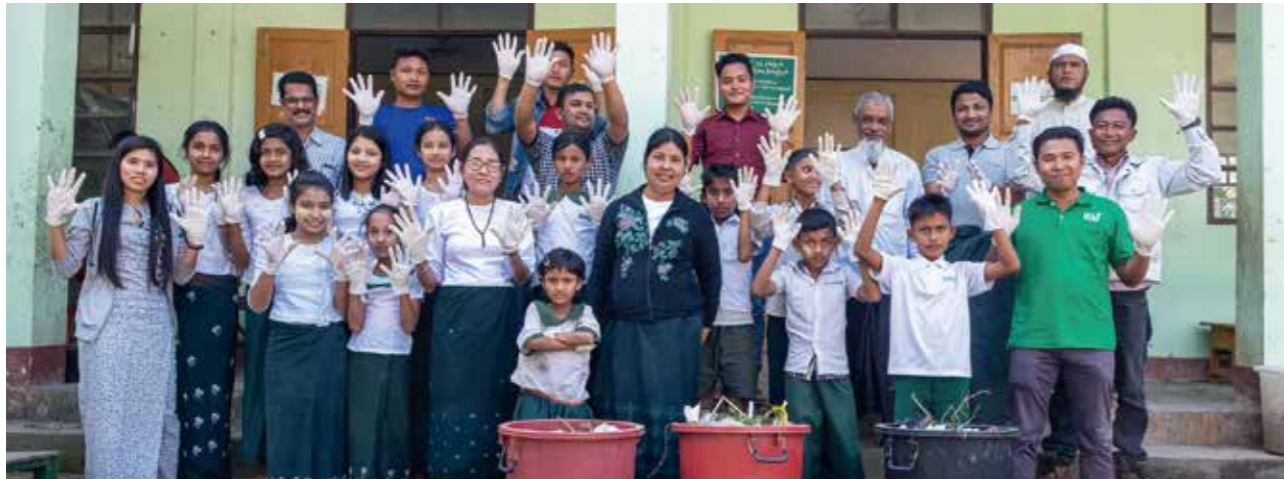
上写真は感染拡大前の2020年に撮影