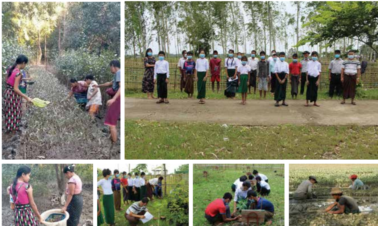
上写真は感染拡大前の2020年に撮影

また環境教育の一環としておこなっている教材樹木園(教材林)の植林活動も、同様に2021年の活動は中止となりました。