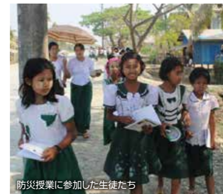
防災授業に参加した生徒たち