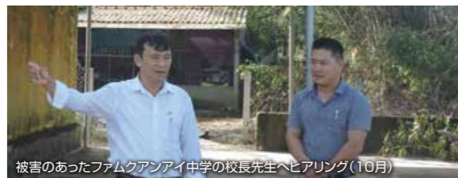
被害のあったファムクアンアイ中学の校長先生へヒアリング(10月)