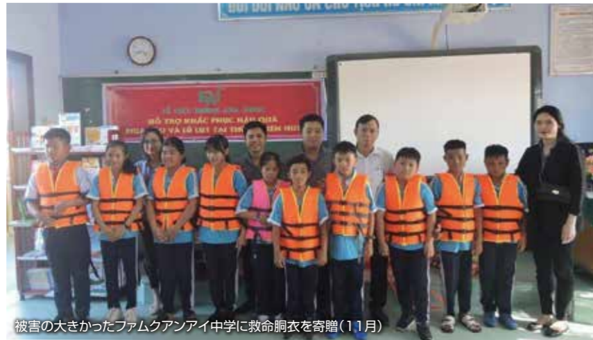
被害の大きかったファムクアンアイ中学に救命胴衣を寄贈(11月)