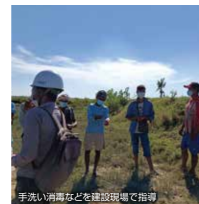
手洗い消毒などを建設現場で指導

BAJはバングラデシュからの難民帰還と再定住に向け、生活環境の改善を目的とした支援ニーズ即応事業を進めてきました。ラカイン州北部の13村で給水設備の改修、学校の修繕、排水設備の整備、村への連絡道路の建設など15の小規模インフラ整備活動を実施しました。新型コロナウイルスの影響を受け、8月から11月まで建設を中止しなければなりませんでした。12月末までに10件の建設が完了し、5件が建設を継続中です。小規模インフラ建設の際には、国連の「キャッシュ・フォー・ワーク」の仕組みを取り入れ、就労機会のない村人に事業参加してもらいました。