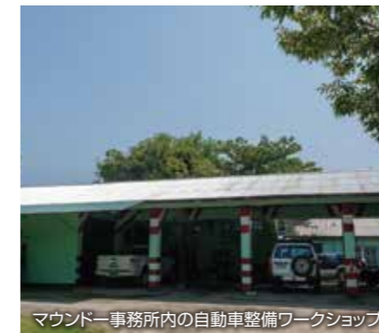
マウンドー事務所内の自動車整備ワークショップ

コロナ禍で国連や国際NGOの活動も必要最小限に制限されるなか、車両などを整備することを通して他団体の活動継続に貢献しました。