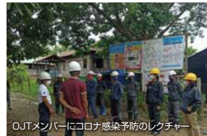
OJTメンバーにコロナ感染予防のレクチャー