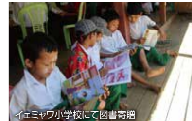
イエマフ小学校にて図書寄贈