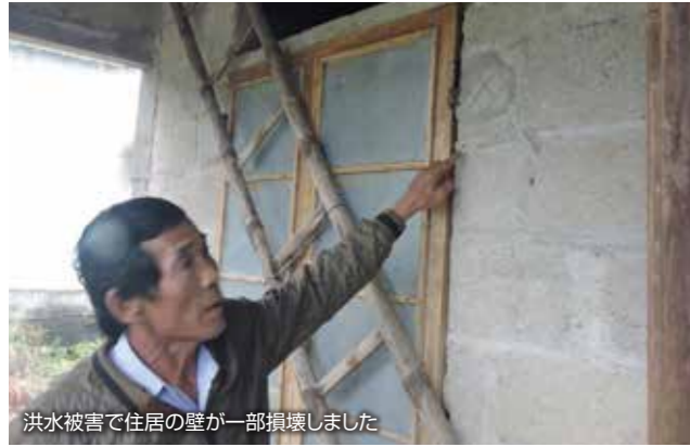
洪水被害で住居の壁が一部損壊しました