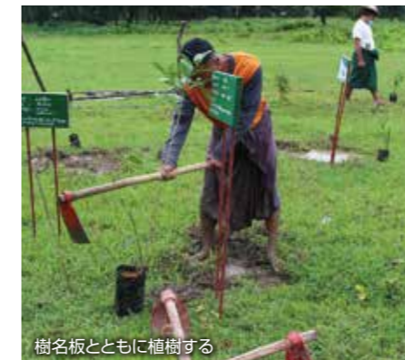
樹名板とともに植樹する