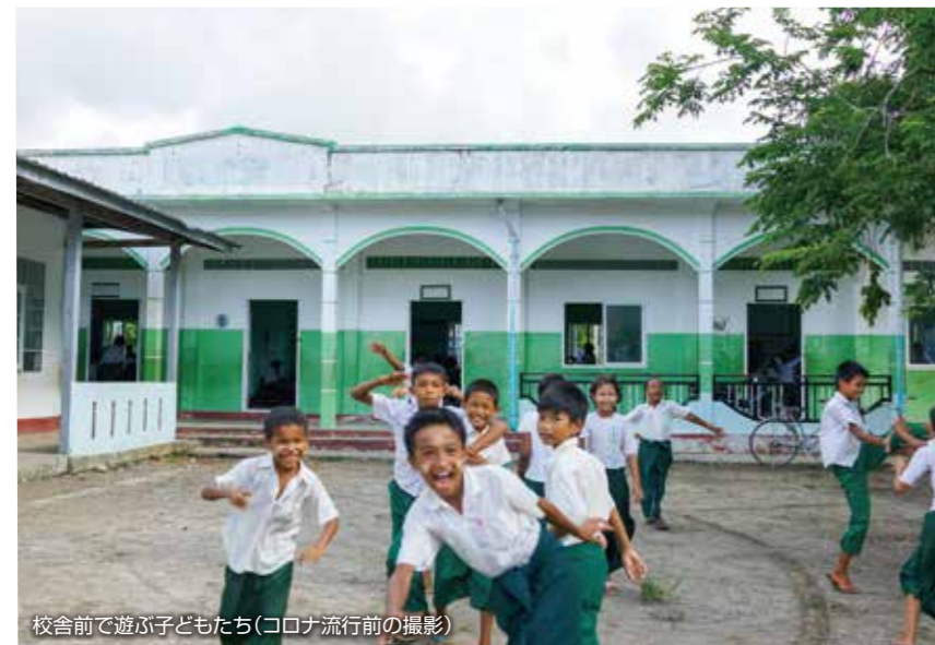
校舎前で遊ぶ子どもたち(コロナ流行前の撮影)

各現場では、監督と左官、大工などの熟練労働者が、村から選抜された約10名の若者を対象にOJTにより建設を進め、一定の出席率と技術を取得したOJT参加者には、修了証書を発行しました。しかし、感染拡大後の8月以降は感染予防の観点からOJT活動の許可が下りず、実施できませんでした。