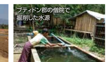
ブティン郡の僧院で掘削した水源