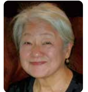
認定特定非営利活動法人 ブリッジ エーシア ジャパン

BAJ東京では、COVID-19に対応して、職員について時短や出勤日の抑制などを実施し、オンラインで事業を進めています。イベントや報告会の実施が不可能となり、理事会や総会、報告会はオンラインで進めました。スタディーツアーや古着回収イベントなどの中止はやむを得ませんが、SNSを活用した広報などに力を注ぎました。BAJは引き続きミャンマーでの事業を進めていきます。皆様のご支援をお願い申し上げます。