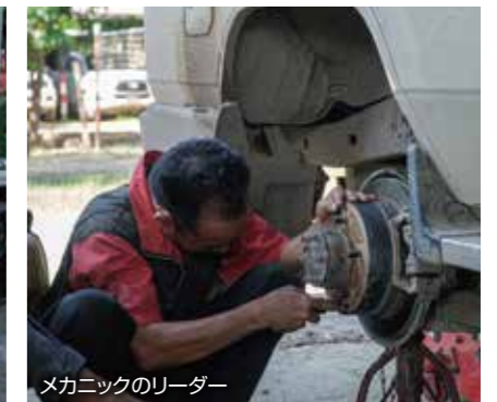
メカニックのリーダー