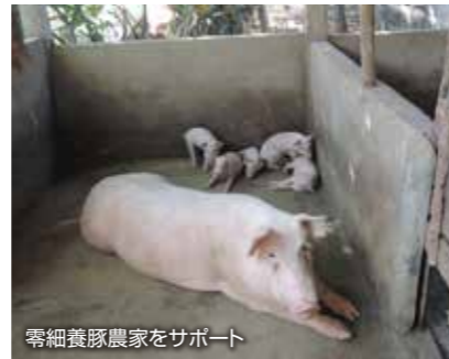
零細養豚農家をサポート