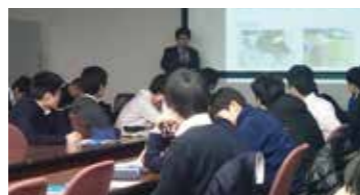
駒場東邦中学・高校で出張授業(2月)

BAJ主催の駐在員報告会や派遣専門家報告会、あるいは外部の依頼による講演・講義、職員のスキルアップのためのセミナーや研修など、主なものは以下の通りでした。