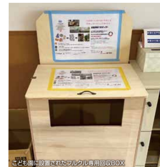
こども園に設置されたフルクル専用回収BOX