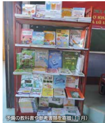
予備の教科書や参考書類を寄贈(11月)