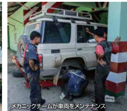
メカニックチームが車両をメンテナンス