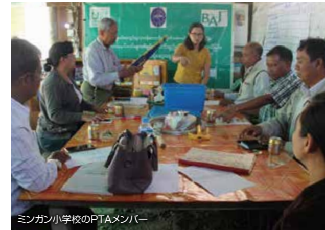
ミンガフ小学校のPTAメンバー

標記事業は学校建設事業第1期終了時におこなった本事業についての参加型評価によるもので、PTAによる学校の維持管理が不十分という結果を受け、第2期よりPTAの研修を開始しました。内容は、PTAによる校舎の保守管理の意識向上と管理能力の強化を旨として、PTAの役割、手洗いなどの衛生知識、ごみ処理などを学ぶ研修です。3年次は対象16校において各4回のPTA研修を計画していましたが、新型コロナウイルスの影響により8月以降活動は停止し、全体の72%が完了したところで、活動が中断となりました。