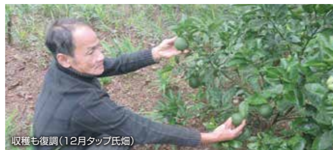
収穫も復調(12月タップ氏畑)