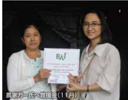
農家カー氏へ救援金(11月)