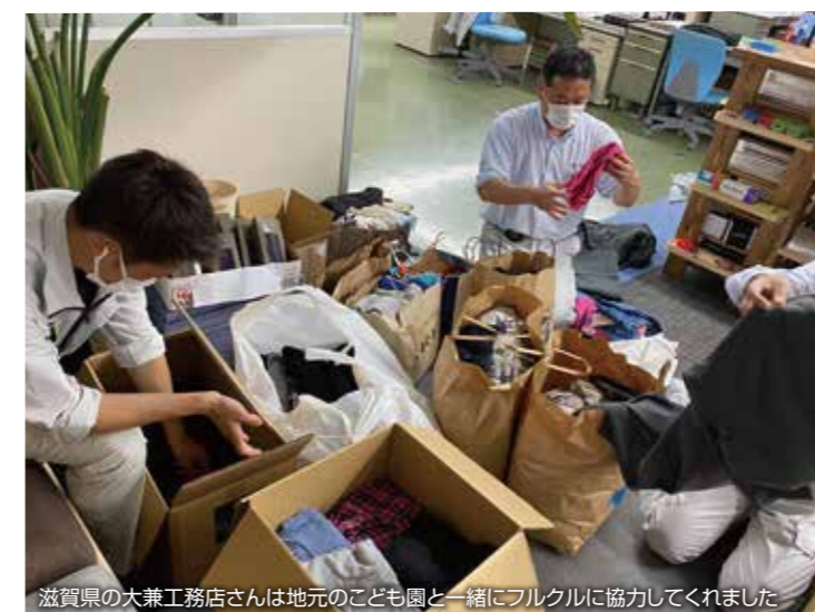
滋賀県の大兼工務店さんは地元のこども園と一緒にフルクルに協力してくれました