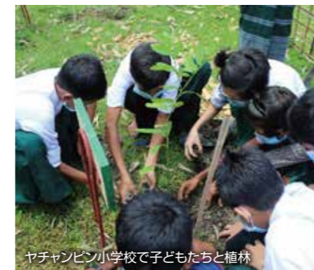
ヤチャンピン小学校で子どもたちと植林

堅牢な学校校舎の建設はサイクロン襲来時の避難所としての機能も持たせていますが、児童や親たちが十分に理解しておらず、校舎を災害時の避難先として認識していませんでした。そこで第2期2年次より児童とPTAを対象に3日間の防災研修とさらに教育環境の整備として教材林の植林と環境教育を追加して実施しています。ラカイン州では毎年のように洪水やサイクロンに見舞われることが多いため、身を守るための基礎知識や災害時の校舎利用方法、村のハザードマップや避難経路の作成などを学びました。22校での実施を予定していましたが、治安の悪化とコロナウイルスの影響から、学校が閉鎖されラカイン州政府から活動実施の許可が下りず、10校での実施にとどまり、児童やPTA、教師など295人が参加しました。4校での実施を予定していた教材林活動は、同じくコロナウイルスの影響を受け、3校においてのみ、教材林の植林活動を実施しました。