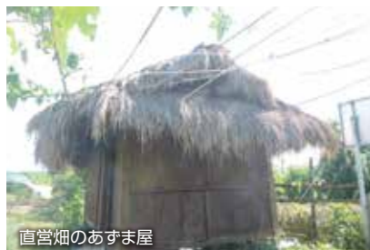
直営畑のあずま屋