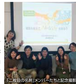
「二枚目の名刺」メンバーたちと記念撮影

2020年は、引き続き1月にヤンゴン市内で「Japan Toy Museum」を開催し、日本からスタディーツアーとして8名が参加しました。その後はコロナ禍で開催を中止しています。