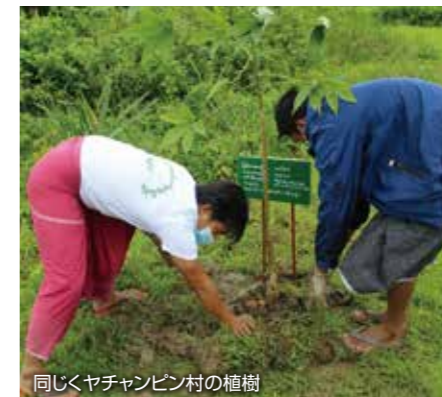
同じくヤチャンピン村の植樹