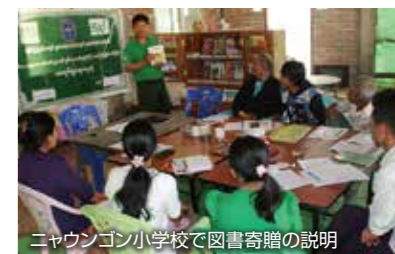
ニャウンゴン小学校で図書寄贈の説明