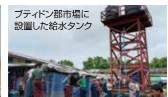
ブティン郡市場に設置した給水タンク