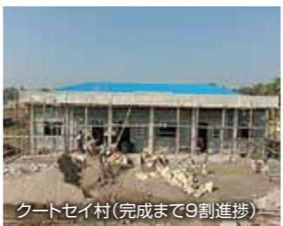
クートセイ村(完成まで9割進捗)