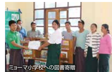
ミョーマ小学校への図書寄贈