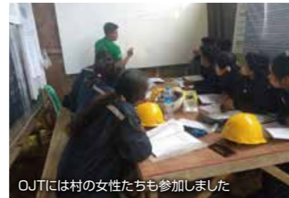
OJTには村の女性たちも参加しました