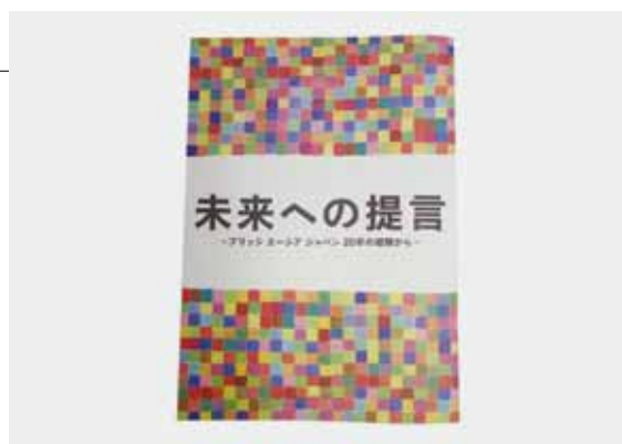
完成した報告書「未来への提言」、BAJの20年の活動をふりかえり、そこから学んだ知見を8つの提言にまとめました