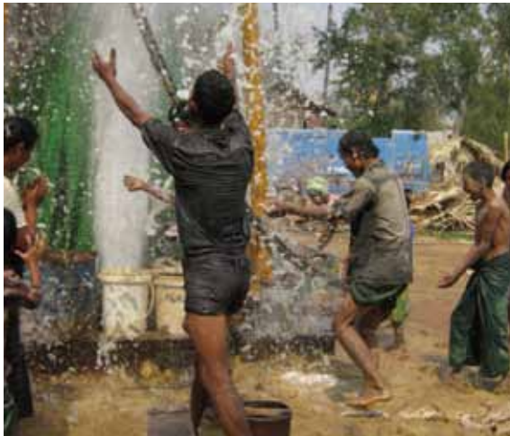
水が出て喜ぶ村の人たち

11月に「水と衛生に関するワークショップ」を13箇村に対して順次実施しました。また、マグウェ事務所に特設会場を設置して、各村から3名の水管理委員合計39名を対象に、情報共有ワークショップ、運営トレーニング、エンジンと揚水ポンプ技術講習会を開催しました。