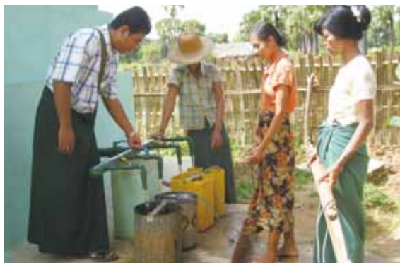
掘削した井戸へひっきりなしに水汲みにやってきます