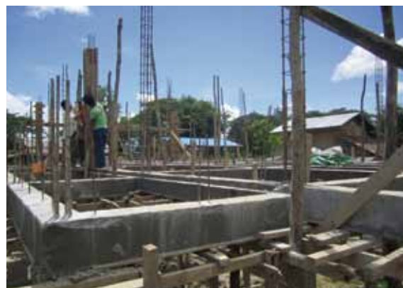
鉄筋の堅固な校舎です