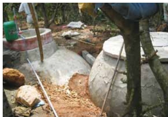
バイオガスダイジェスターは農家の人たちが協力して建設

生活排水が流れだしていたトゥイスワン地区の協同水洗い場と、家畜の解体場所の2か所に簡易浄化装置を設置しました。