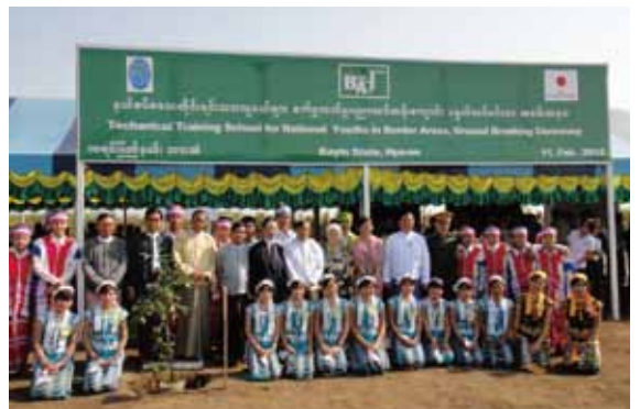
カレン知事を迎えて学校建設の起工式を実施しました