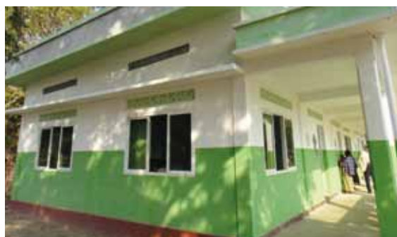
マウンドーの新しい小学校です