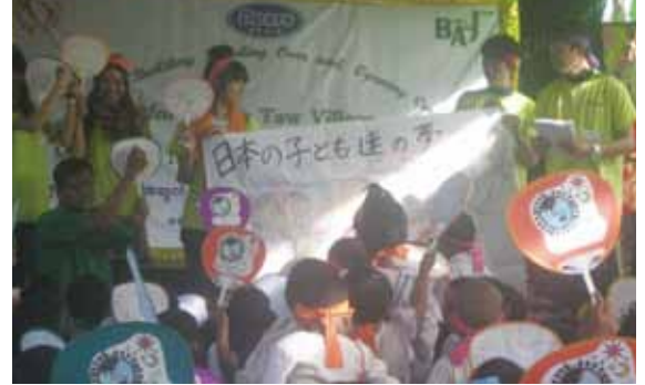
村の人たちに日本の子どもの夢を披露

ディアーズブレイン様の提案で、小学校校舎建設の費用をご寄付いただき、ショードー村に新校舎を完成させました。11月には完成した校舎で、就職内定者の学生さん22名を受入れ、彼らの企画による校舎引渡しのイベントを開催しました。村にとって日本という国と人を大きく印象付けた取組みでした。