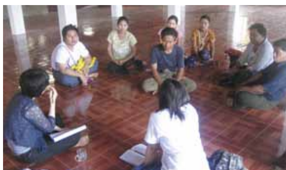
清潔に保つことが大切なことを話し合います

新規給水施設を実施した村を対象に、維持管理講習としてエンジンやポンプ操作とメンテナンスについて、また水管理委員会の役割について話し合ってもらいました。また衛生講習では、関心の高い住民20名を対象に、「水・料理・トイレ・手」を清潔に保つことの理解を進めました。さらに5名を衛生プロモーターとして村のなかで知識を定着するためにうごいてもらうようにしました。