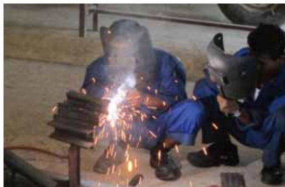
溶接トレーニング、真剣です

7月に標記トレーニングコースの研修生を募集したところ、20名の定員に70名あまりの応募があり、こうしたトレーニングの需要が大きいことが分かりました。9月にコースを開始し、2ヶ月間のコース終了時には、20名中15名が卒業証書を手に入れました。