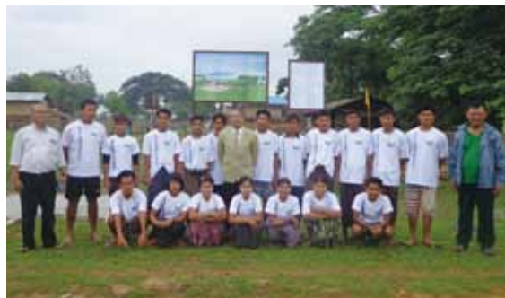
建設チームのメンバー

2012年の騒乱事件で中断されていたコミュニティー建設を2013年5月より再開し、3棟を建設予定でしたが、1棟は許可が下りなかったため中止し、2棟を完成させました。家を失った被災民のためのシェルター建設は、300名を超える期間限定の雇用を生み、さらに参加した地域住民に建設技術を伝えることができました。