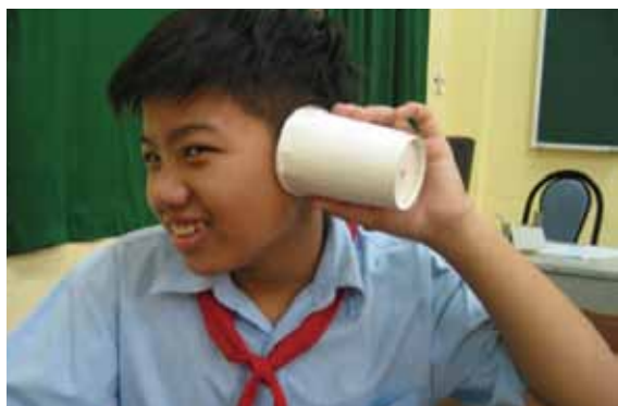
糸電話で音の伝わり方を実験

2012年度から引き続き、毎週火・水・金曜日の3日間の夕方と、土曜日の午前・午後で子ども教室の授業を実施しました。教室の出席した子どもは小学校2年生から5年生までの22人でした。