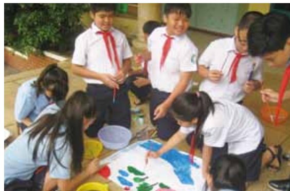
地域の地図をつくることで課題がみえてきます