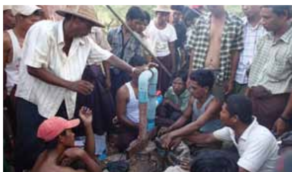
井戸の修繕は村の若者にとって興味の対象です

BAJが建設した井戸で不具合が生じた井戸について、カレン州9か所、モン州6か所、計15か所の井戸を修繕しました。