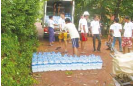
飲料水を村人に配布しました

7月下旬～8月上旬に南東地域の降雨量が急増し、大規模な洪水に発展しました。そのためモーラマイン事務所は被害の大きかった3村について緊急救援物資を3,073人(731世帯)に配布しました。