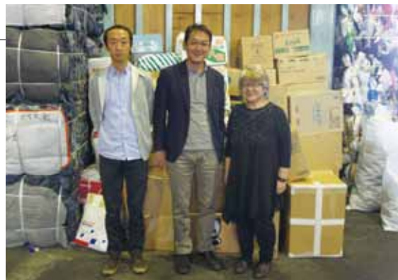
BAJ倉庫に届いた皆さまからのダンボールの前で、日光物産の方と

HAPPY BOOK(本・CD・DVD・ゲーム等の回収) については、今後広報を強化して広げていきます。