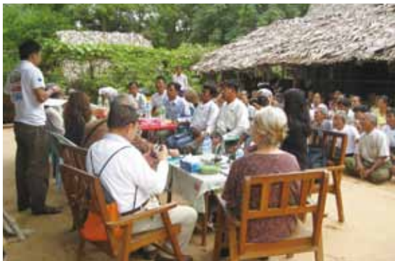
プラン・ジャパンの視察で村人と交流

2月にサンピヤ村に完成した井戸について、8月にプランジャパン理事長をはじめ4名のボードが視察を行いました。スーピーサン村の井戸掘削ではたびたび逸水(泥水を循環しながら掘削していきますが、何らかの理由で泥水が逃げてしまいポンプを回せなくなる状況)が起き、穴をふさぐために大量の泥粉を孔に投入しました。また掘削を予定していたある村では住民間の合意ができていなかったため、行政機関と協議しながら別の村での掘削を行う、ということもありました。