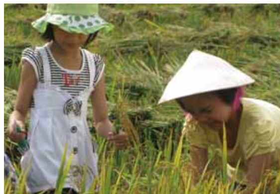
農家のお手伝いをしながら、食べ物について考える