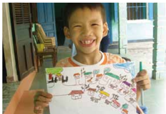
ほくの家の近くの地図だよ

■ 各地区(トゥビエウ地区、トゥイスワン地区、シア町アンザー集落)で 実施した環境教育の学習内容は以下の通りです。