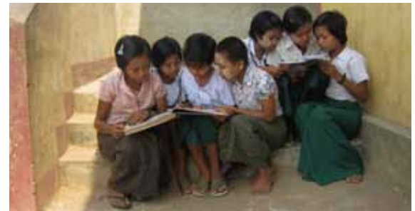
届いた本を皆で読む

2012年12月から開始した「小さな図書室100プロジェクト」では、多くの個人の支援者からご寄付をいただきました。中央乾燥地域の9箇村の小学校に対し、各小学校に240冊、総計約2,000冊の図書と本棚を寄贈し、同時に先生方を対象に、図書の貸し出しトレーニングを実施しました。どの学校でも、子どもたちの強い読書への興味と村人たちの深い感謝を受けました。