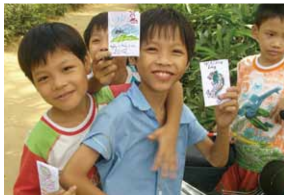
畑を観察したら、こんなことに気がついた