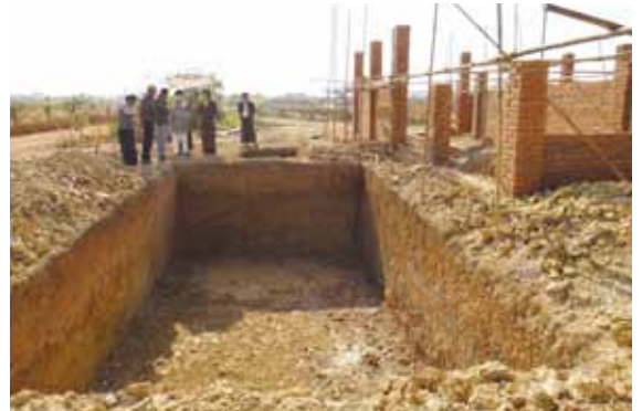
校舎の建設現場では、研修生が指導を受けながら進めています

事業内容として、徹底した理論・実技を通し技術の習得(建設カリキュラム:合計660時間、内訳:理論375時間&実技285時間)と、日本の国家資格レベルの技術習得(二級建築士、自動車整備士3級、電気工事師)を実施します。技術訓練学校校舎も建築コース訓練生によりOJTで建設します。また、電気・自動車コースの修了生が外からの仕事を受けられるようにワークショップを設置して収入を図ります。さらに政府認定付きの修了証を発行します。