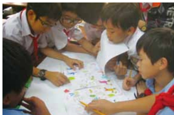
話し合いながら協力してまとめていく力をつけます

ホーチミン市の大学に通う大学生や大学院生が中心になって、ゴイサオ学校(中高一貫)で環境学習・科学工作の授業について、5月半ばまで実施しました。6年生～11年生の計18クラスを対象に、毎週月曜日～金曜日授業を実施しました。授業の内容は、地域の紹介や地図づくり、身の回りの水について、ゴミの問題、日本の公害問題、電気野実験、光や音の実験、などです。