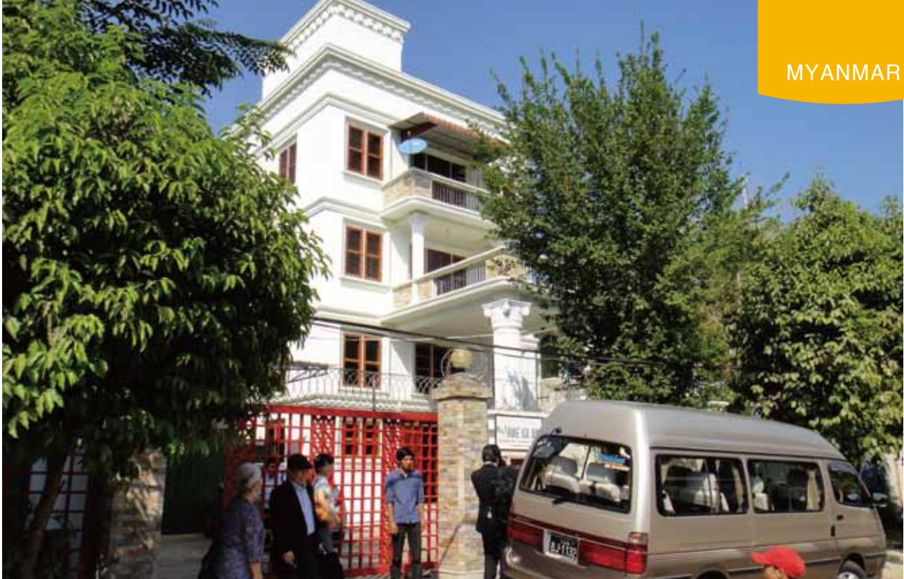
ヤンゴン事務所は4階建てです