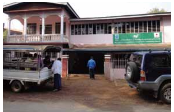
パン市内に借りた研修生の宿舎