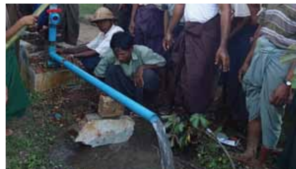
水が出たあとも水質や水量を測ります

復旧が困難な井戸が4本もありました。またチャウンブーム村は4月に修繕の必要なしと判断しましたが、半年後に再チェックした結果、修繕が必要となりました。BAJのポアホールカメラが威力を発揮しました。