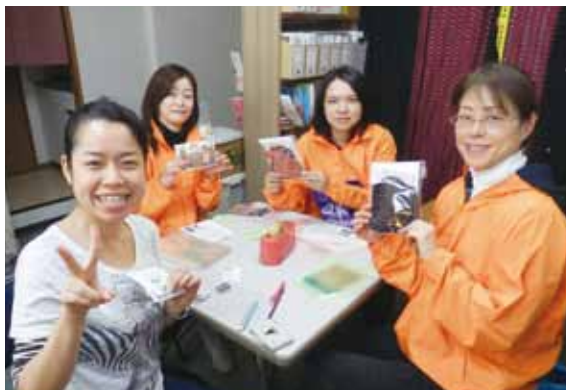
BAJの事務所に参加して下さったボランティアさん

2013年は後半に入って各事業の申請が順調に進みました。その結果、新規事業のマンマー・カレン州バアン技術訓練学校資金約6,000万円、ラカイン州シトウェの学校建設事業約1億5,000万円などが採択されました。