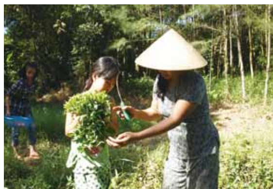
野菜は大切にそだてられているんだね