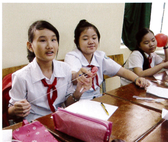
ゴイサオ学校の生徒さんから元気な質問が出ました