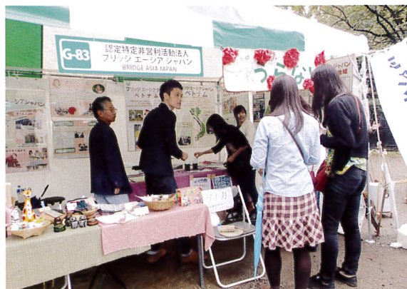
毎年恒例のグローバルフェスタではボランティアさんが中心です