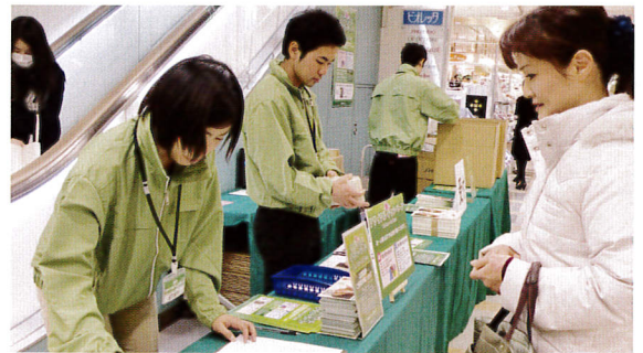
大型店舗で開催された古着回収イベントでたくさんの古着が集まりました

2012年度の1月～12月の倉庫受け取り分は、5,130箱で35,607.32キログラムでした。