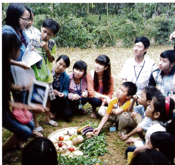
トゥイビエウ地区でBAJIKO教室の野菜の絵の紹介