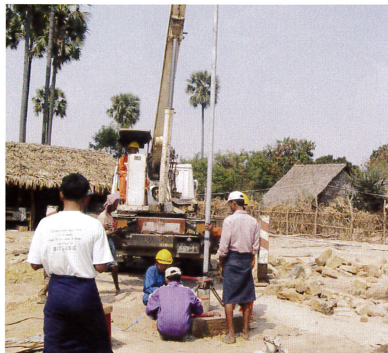
つりあげたパイプを堀削した孔におろしていく

三脚とは、修繕では井戸からロッドを引き上げるために三脚が必要で、彼らは自分たちでその三脚を制作したという経緯があります。