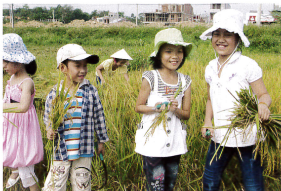
稲刈りも友だちみんなとやると楽しい

フービン地区、トゥビエウ地区、トゥイスワン地区の補習・絵画クラスの子どもたちに環境教育や地域を知ってもらう活動をしました。またトゥイスワン地区のゲンティミンカイ中学校の1年生を対象に9月から12月まで毎月2回、環境の授業を行いました。