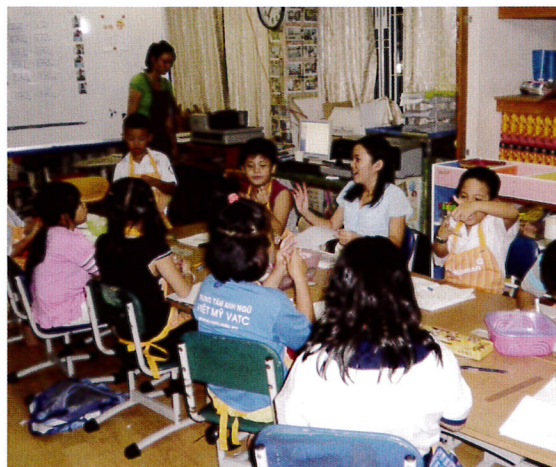
BAJIKOの子どもたちは工作が大好き