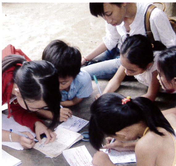
スタッフも子どもたちにアドバイスしながら見守ります

フエ市アンドン地区は製粉・製麺所が多い地域で、工場からの排水垂れ流しが問題となっていました。BAJでは2カ所の工場に簡易浄化槽を設置して、排水についての観察を続けて排水中にふくまれる成分や排水量を特定し、2012年3月に浄化槽の設置を完了しました。