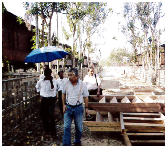
2ヶ月間で80棟のシェルターを建設

建設では、被災したモーヤワディ村の住民と、村外から集められた労働者（ラカイン人、ビルマ人、ムスリム）約160名が参加して、各機関と調整しながら、現場スタッフの尽力により、ほぼ工期通りの完成でした。完了直後には、UNHCR、ナタラほか政府関係機関の視察を受け、BAJの建設技術を高く評価していただきました。