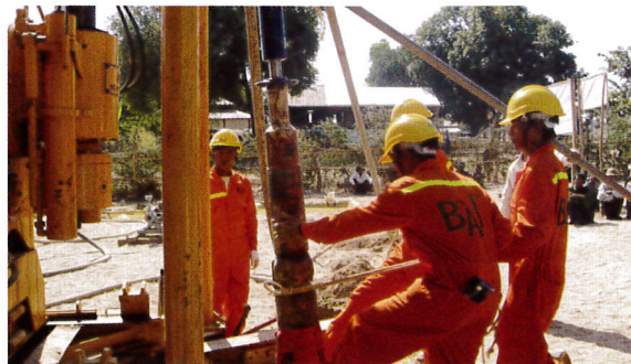
危険な作業もあるのでチームワークが大切