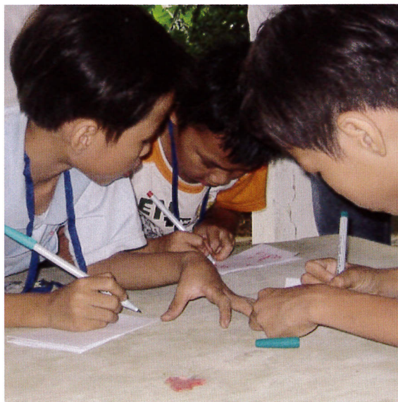
トゥイビエウ地区の子どもたちがレポートを書く…。 「なんて書いたの？」

日本予防医学協会では、国内で中古メガネの寄贈を受けており、ベトナムでの配布を希望されたため、BAJが配布のお手伝いをしました。2012年1月3日～6日までの4日間で、フエ市トゥイビエウ地区、フーヴァアン郡ヴィンハー地区・ヴィンタイ地区、フォンチャー郡フオンスワン地区、フーロック郡ヴィンジャン地区の6箇所で、眼鏡の配布を実施しました。日本予防医学会から3名の専門家が参加して、検眼、眼鏡の選定・調整を行ったうえで、一人ひとりの状態にあわせた眼鏡を調整して、全体では256名に配布しました。