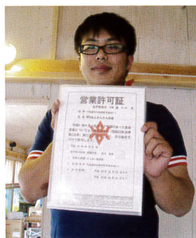
さんさんキッチンの 営業許可証がとれました

大船渡市「NPO法人 さんさんの会」は、震災後に立ちあがった地元のグループで、BAJはJPF(ジャパンプラットフォーム)の助成金を活用した第2フェーズとして、配食を中心としたコミュニティ活動事業を、2月11日～10月12日の期間で支援しました。また、9月22日に覚書を交わし、NPO法人として必要なスキルの研修を2回にわたって実施しました。