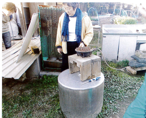
霜里農場でバイオガスコンロの実験