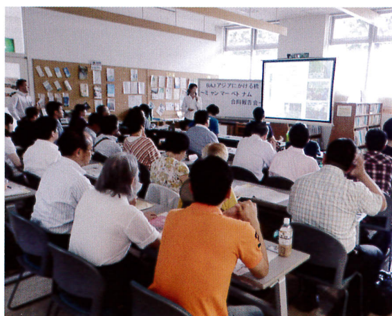
一時帰国したBAJスタッフの報告会では、現場の様子がよく分かる