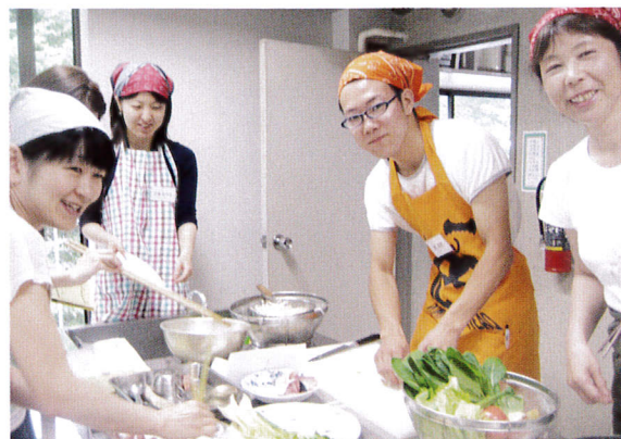
男性もエプロンを着けて参加、ベトナムおうちごはんDE国際協力

■外部からの依頼による、あるいは申請して実施した主な講演やイベントは以下の通りです。