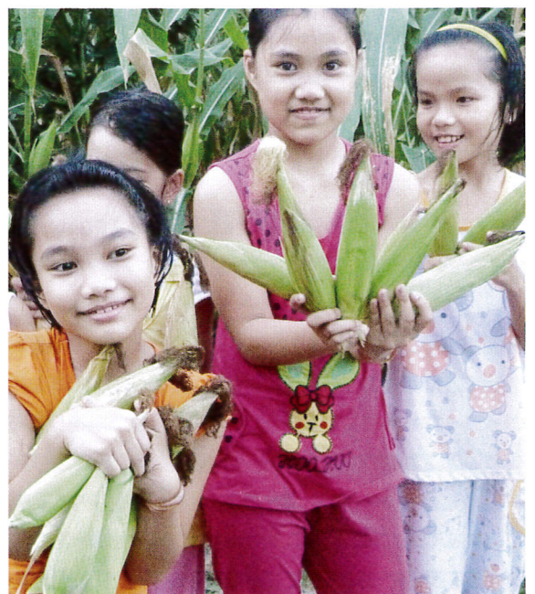
トウモロコシがこんなに収穫できた

トゥイスワン地区の家畜飼育農家を対象に、環境汚染対策と収入向上を目指して、バイオガスダイジェスターを設置し、副産物として採取したガスを燃料にしたり、液肥で有機栽培を行うなどリサイクル農業を実践しています。2011年8月から開始して2012年末に25世帯まで増え、農家グループとして畜産物を消費者に直接販売する提携を始めています。