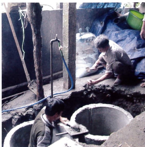
住民も参加してバイオガスダイジェスターの設置作業