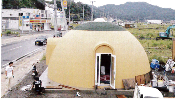
大槌町に建てられたドームはコミュニティセンターとして大活躍