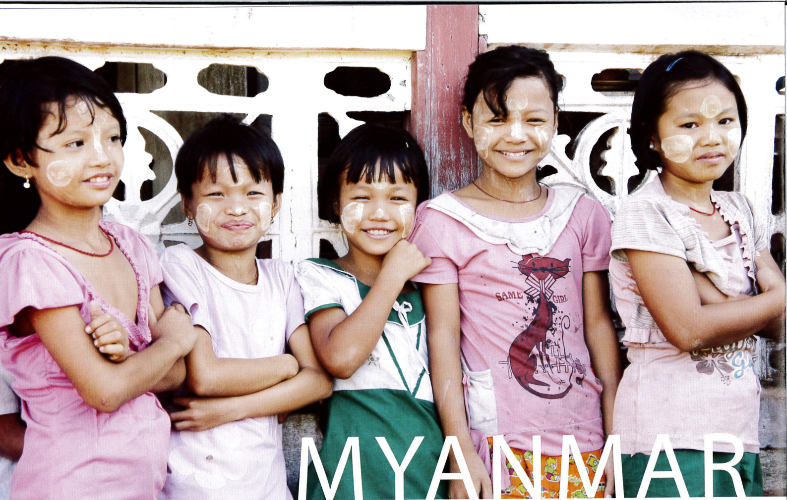
「タナカ」という特殊な木をすりおろした汁を顔や腕に塗っている少女たち。都市部では見られなくなっています