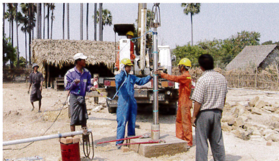
さまざまなデータを取りながら、慎重に作業を進めていく